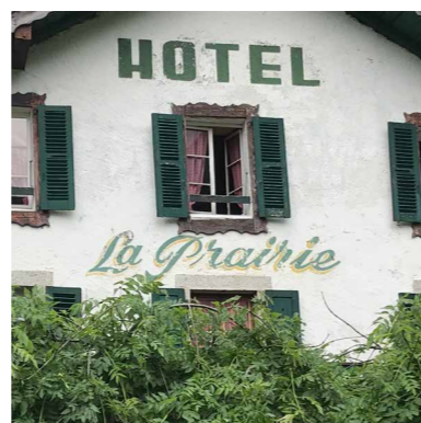
Conception : Cybergraph Chamonix

OFFICE DE TOURISME DE LA VALLÉE DE CHAMONIX-MONT-BLANC