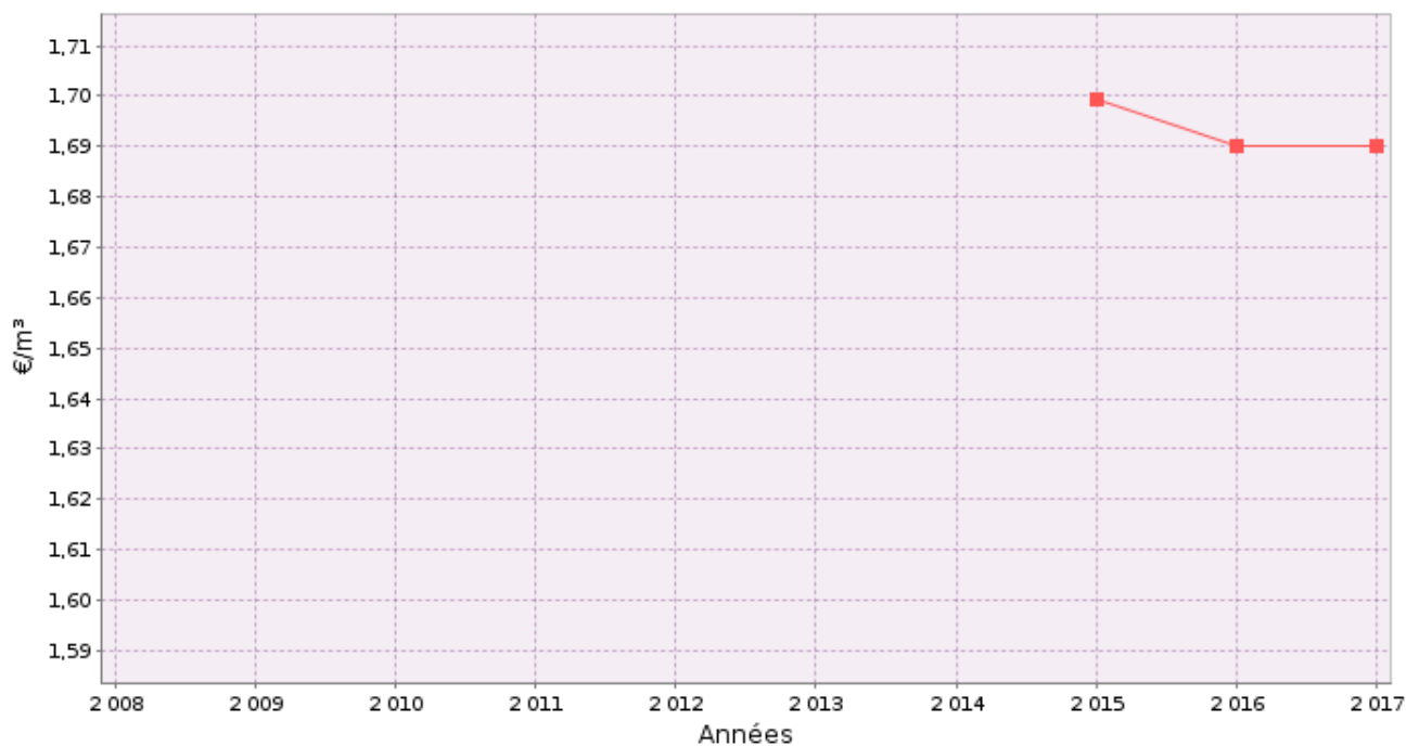
■ D204.0 Prix TTC du service au m³ pour 120 m³ au 1er janvier N+1

Dans le cas d'un EPCI, le tarif pour chaque commune est :