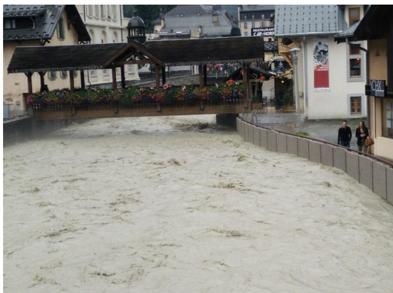
Chamonix Août 2014

Avec le concours du SM3A, la ville de Chamonix Mont-Blanc vient de poser un repère de crue sur le quai des Moulins pour matérialiser la crue du 26 août 2014, plus hautes eaux connues récemment.